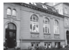
La Oficina, Frederiksberg www.laoficina.dk