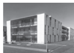
Innovatorium, Herning www.innovatorium.info