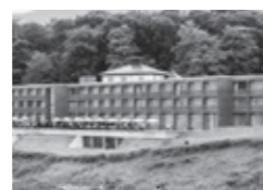
Hotel Marselis, Århus www.helnan.dk/marselis