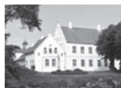
Nørre Vosborg www.nrvosborg.dk